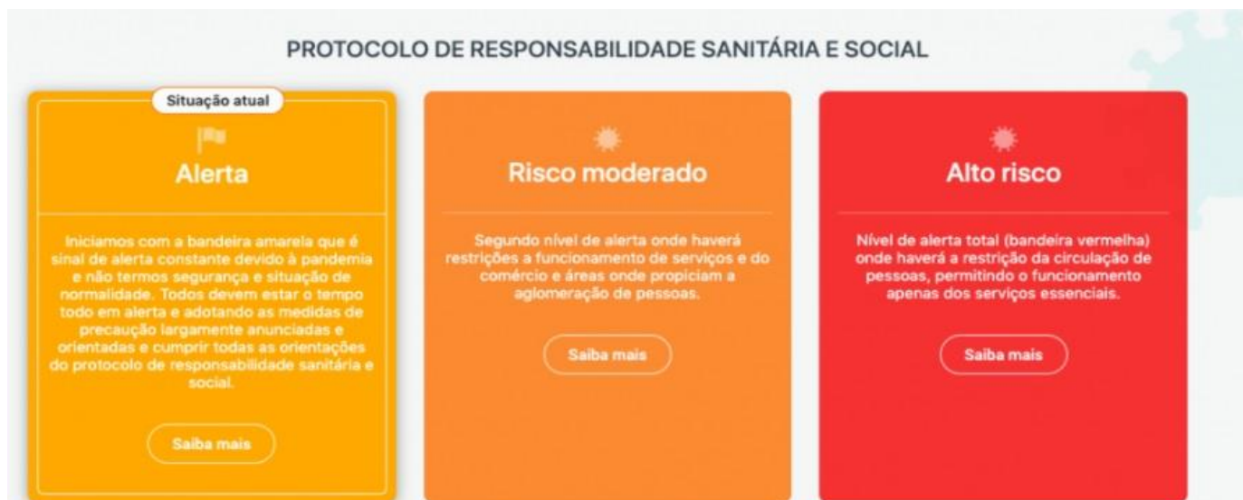
FIGURA 1 – SITUAÇÃO DE RESTRIÇÕES